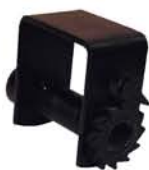
SOPORTE DE SUJECCIÓN