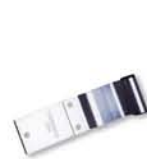
BISAGRA 3/4" DE 3 BARRENOS