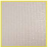
ROLLO INTEGRADO ARMOR TUF