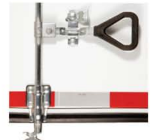
KIT CERROJO ITALIANO MERIK

Disponible para todo tipo de camión. Acabado en Acero Zincado Inoxidable. Sobre pedido.