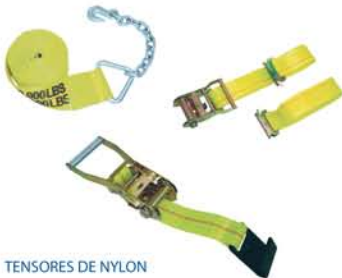
TENSORES DE NYLON