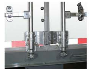
KIT CERROJO ANTITRAQUETE POWER BRACE

Diseñado para camión y remolque heavy duty . Acabado en Acero Galvanizado Inoxidable. Sobre pedido.