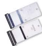
BISAGRA 4" DE 3 BARRENOS