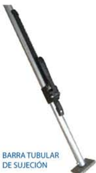
BARRA TUBULAR DE SUJECCIÓN