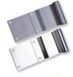
BISAGRA 4" DE 4 BARRENOS NOTA: SOBRE PEDIDO